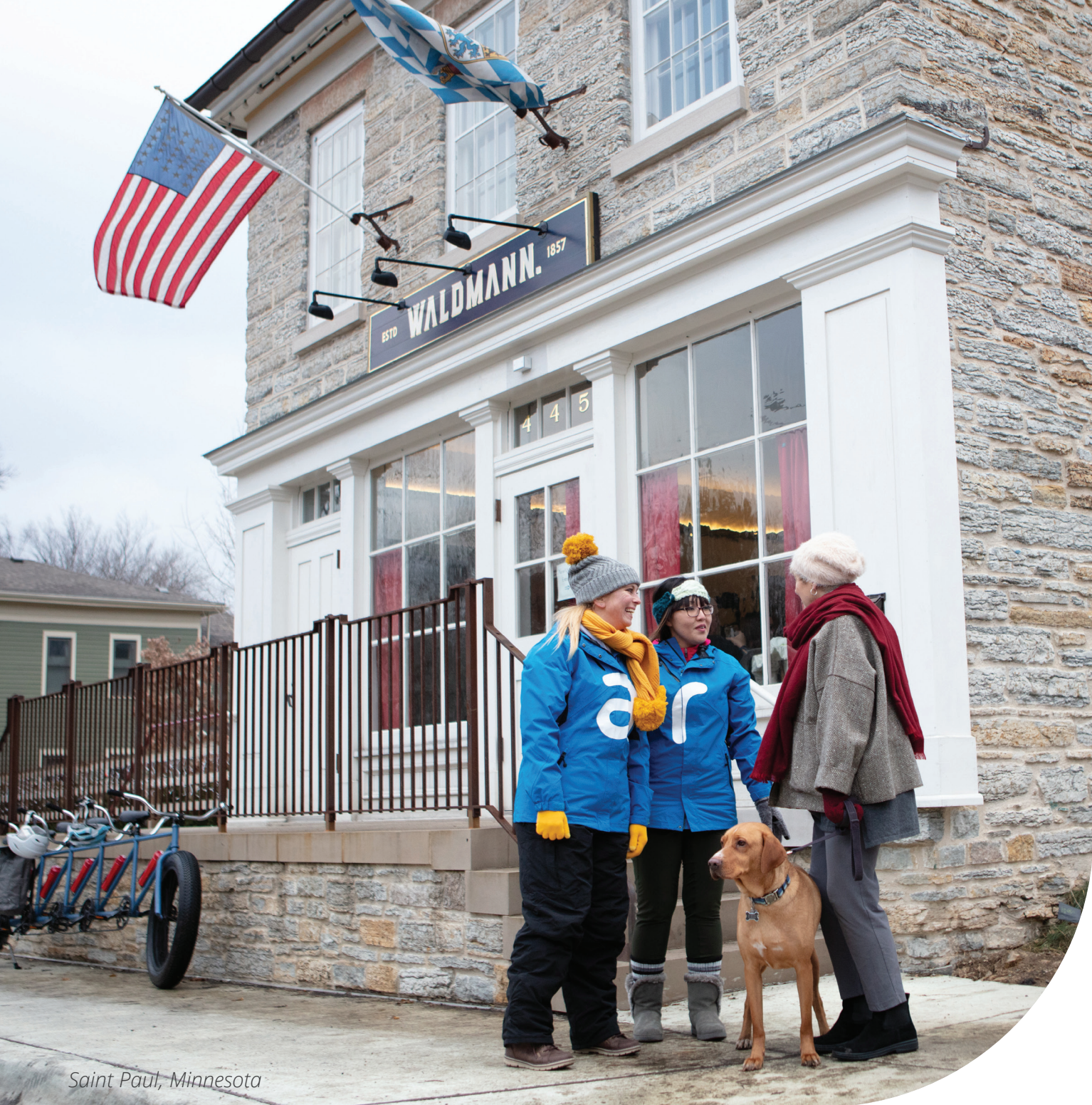
Saint Paul, Minnesota